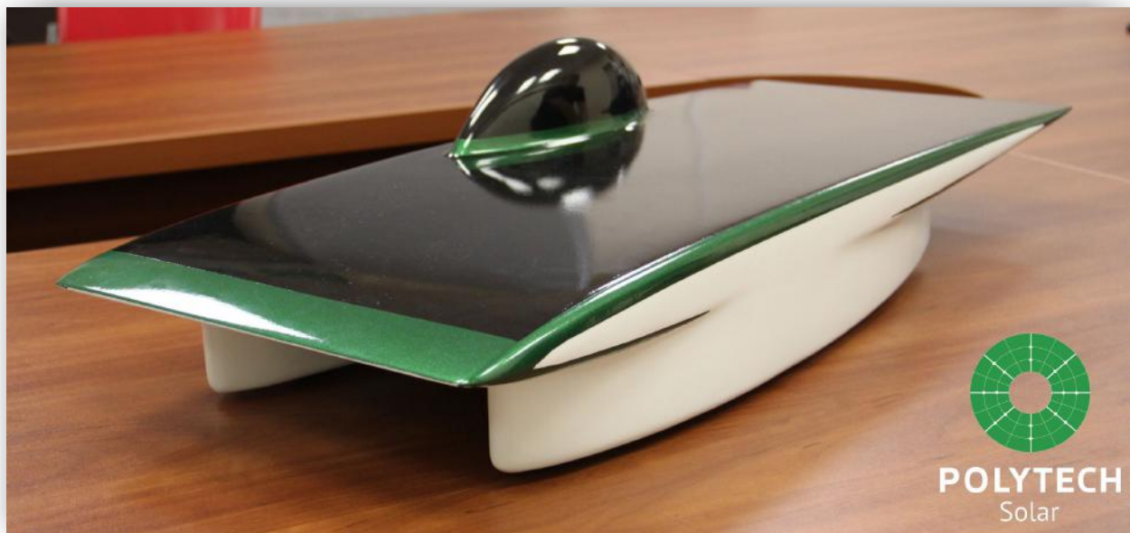
Макет солнцемобилей «SOL» в масштабе 1:6